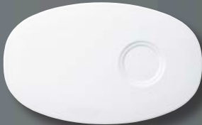
OCR-Nr. 16-4004-1550 | Party plate 280 x 175 mm · 11 x 6 3/4 in. (Articles, Articles, Artikel, Artículos, Articoli OCR-Nr. -0220, -0630, -0800, -1240, -1270, -1271, -1360, -1905, -2513, -2514, -3831, -4870, -4891, -4895, -4910)