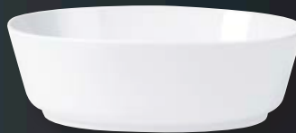
OCR-Nr. 16-4004-3287 | Oval salad bowl Saladier ovale · Salatschüssel oval · Ensaladera ovalada Insalatiera ovale 350 x 300 mm · 13 ¾ x 11 ½ in. | 6,50 l · 219 ½ ozs.