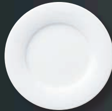
OCR-Nr. 16-4004-2640 | Flat plate · Assiette plate Teller flach · Plato llano · Piatto piano Ø 210 mm · 8 ¼ in.