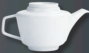
OCR-Nr. 16-4004-0070 | Coffeepot with cover Cafetière avec couvercle · Kaffeekanne mit Deckel Cafetera con tapa · Caffettiera con coperchio 1,00 l · 34 ozs.