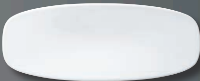
OCR-Nr. 16-4004-2908 | Oval coupe platter Plat coupe ovale · Coupeplatte oval · Fuente coupe ovalada · Piatto coupe ovale 480 x 145 mm | 18 ¾ x 5 ¾ in.