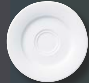
OCR-Nr. 16-4004-1280 | Saucer · Soucoupe Untere · Plato para taza · Piattino tazza Ø 160 mm · 6 1/4 in. (Cup, Tasse, Tasse, Taza, Tazza OCR-Nr. -0780, -0800, -1240, -1270, -1271, -1450, -1451, -3831, -4910)