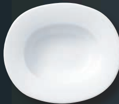
OCR-Nr. 16-4004-2760 | Oval deep plate Assiette creuse ovale · Teller tief, oval · Plato hondo ovalado · Piatto fondo ovale 230 x 200 mm · 8 ½ x 8 in. | 0,36 l · 12 ½ ozs.