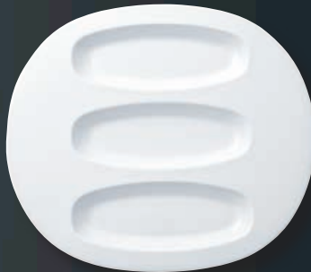
OCR-Nr. 16-4004-2597 | Oval flat coupe plate Assiette coupe plate ovale · Coupeteller flach, oval Plato coupe llano ovalado · Piatto coupe piano ovale 350 x 300 mm | 13 3/4 x 11 1/2 in.