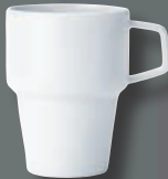
OCR-Nr. 16-4004-4895 | Mug stackable with handle Chope empilable avec anse · Becher mit Henkel, stapelbar Jarra apilable con asa · Bicchieri sovrapponibile con manico 0,40 l · 13 ½ ozs.