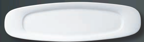
OCR-Nr. 16-4004-2910 | Oval platter · Plat ovale Platte oval · Fuente ovalada · Piatto ovale 500 x 150 mm | 19 ¾ x 5 ¾ in.