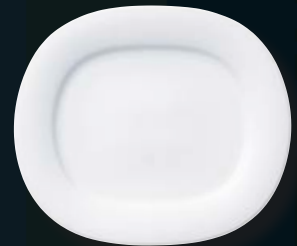
OCR-Nr. 16-4004-2710 | Oval flat plate Assiette plate ovale · Teller flach, oval · Plato llano ovalado · Piatto piano ovale 320 x 280 mm | 12 ½ x 11 in.