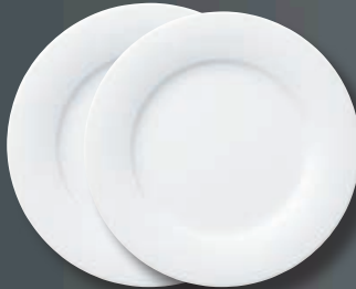
OCR-Nr. 16-4004-2600 | Flat plate · Assiette plate Teller flach · Plato llano · Piatto piano Ø 295 mm · 11 ¾ in. OCR-Nr. 16-4004-2610 | Ø 285 mm · 11 ¼ in.