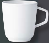
OCR-Nr. 16-4004-4870 | Mug with handle Chope avec anse · Becher mit Henkel · Jarra con asa Bicchiere con manico 0,40 l · 13 ½ ozs.