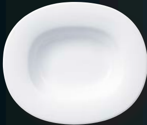
OCR-Nr. 16-4004-2761 | Oval deep plate Assiette creuse ovale · Teller tief, oval · Plato hondo ovalado · Piatto fondo ovale 290 x 240 mm · 11 ¼ x 9 ½ in. | 0,50 l · 17 ozs.