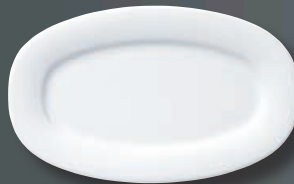
OCR-Nr. 16-4004-2930 | Oval platter · Plat ovale Platte oval · Fuente ovalada · Piatto ovale 280 x 175 mm · 11 x 6 ¾ in.