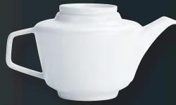
OCR-Nr. 16-4004-0220 | Coffeepot with cover Cafetière avec couvercle · Kaffeekanne mit Deckel Cafetera con tapa · Caffettiera con coperchio 0,40 l · 13 ½ ozs.