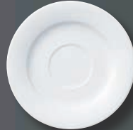
OCR-Nr. 16-4004-1250 | Saucer · Soucoupe Untere · Plato para taza · Piattino tazza Ø 180 mm · 7 in. (Cup, Tasse, Tasse, Taza, Tazza OCR-Nr. -1360, -1905, -2513, -2514, -4870, -4891, -4895)