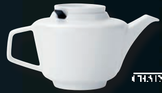
OCR-Nr. 16-4004-0465 | Teapot with cover/filter Théière avec couvercle/filtre · Teekanne mit Deckel/Filter Tetera con tapa/filtro · Teiera con coperchio/filtro 1,00 l · 34 ozs.