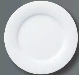
OCR-Nr. 16-4004-2620 | Flat plate · Assiette plate Teller flach · Plato llano · Piatto piano Ø 270 mm · 10 ½ in.