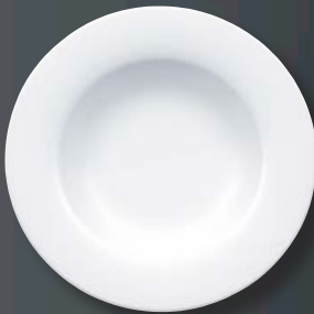
OCR-Nr. 16-4004-2701 | Deep plate · Assiette creuse Teller tief · Plato hondo · Piatto fondo Ø 290 mm · 11 ¼ in. | 0,62 l · 21 ozs.