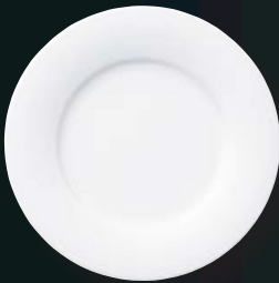
OCR-Nr. 16-4004-2630 | Flat plate · Assiette plate Teller flach · Plato llano · Piatto piano Ø 240 mm · 9 ½ in.