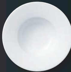
OCR-Nr. 16-4004-2700 | Deep plate · Assiette creuse Teller tief · Plato hondo · Piatto fondo Ø 230 mm · 9 in. | 0,31 l · 10 ½ ozs.