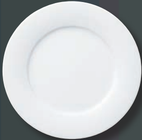
OCR-Nr. 16-4004-2590 | Flat plate · Assiette plate Teller flach · Plato llano · Piatto piano Ø 315 mm · 12 ¼ in.