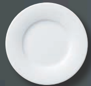
OCR-Nr. 16-4004-2660 | Flat plate · Assiette plate Teller flach · Plato llano · Piatto piano Ø 160 mm · 6 ¼ in.